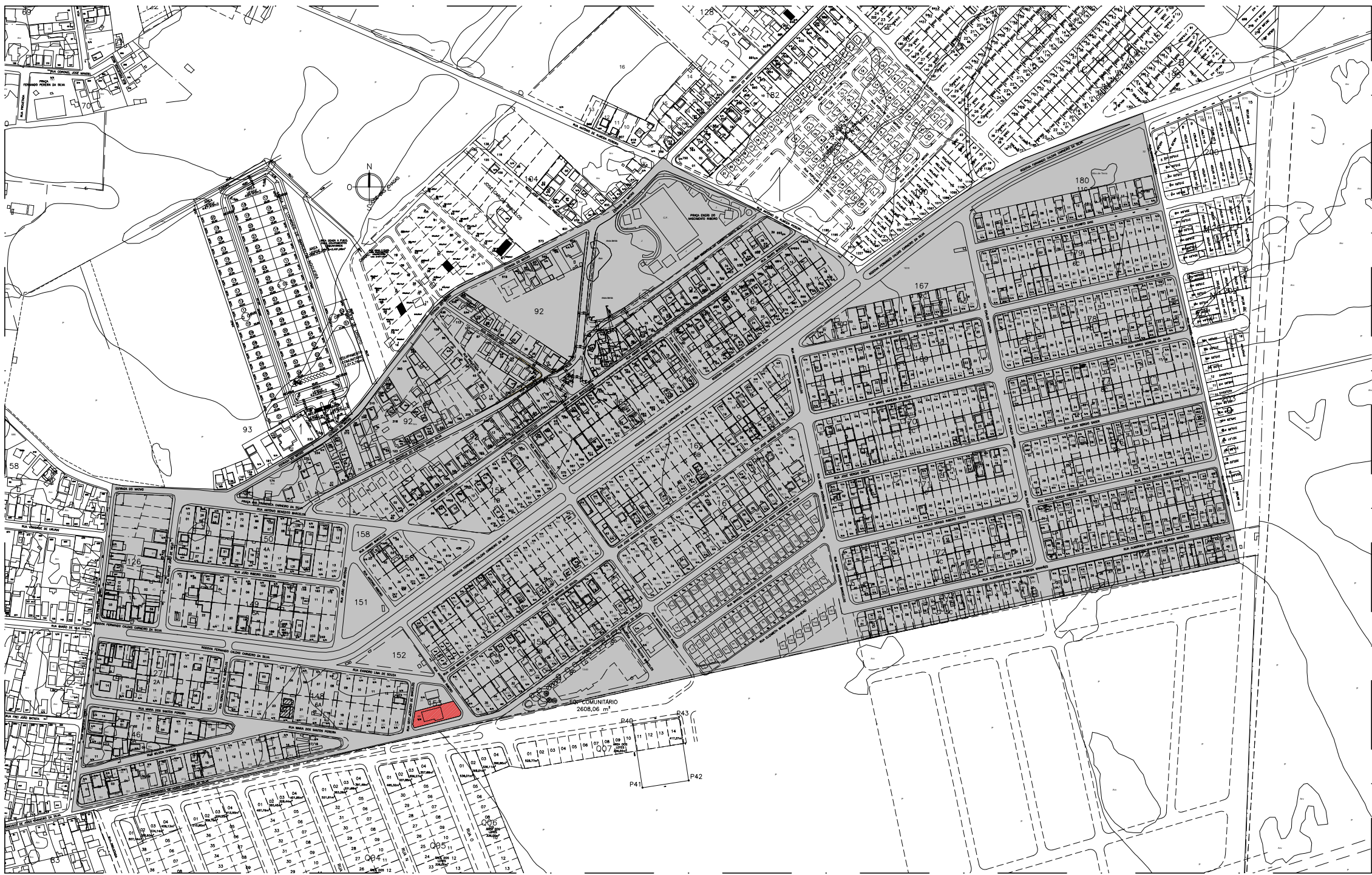
PLANTA DE LOCALIZAÇÃO – LOTEAMENTO SÍTIO QUISSAMÃ ESC.: 1:5.000