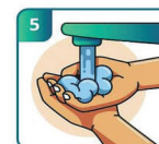
ENXAGUE BEM AS MÃOS