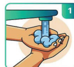
MOLHE BEM AS MÃOS