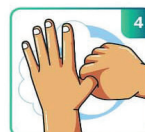
ESFREGUE ENTRE DEDOS