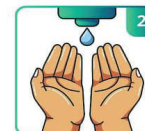
USE SABONETE DE PREFERÊNCIA LÍQUIDO