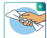
SEQUE BEM AS MÃOS