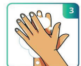
ESFREGUE AS MÃOS ATÉ FAZER BASTANTE ESPUMA