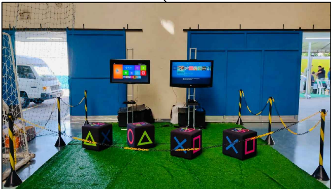
MODELO ADOTADO DA ARENA GAMER.