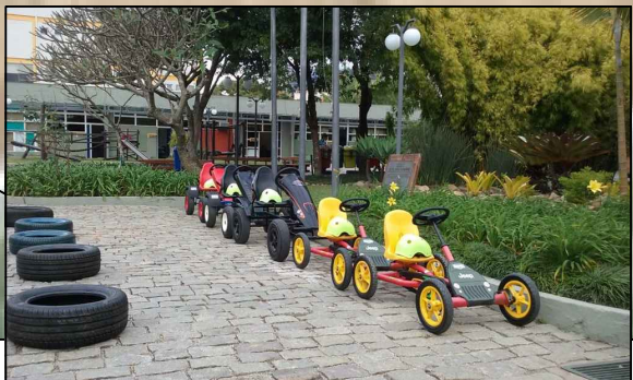
MODELO ADOTADO PARA PEDAL KARTS.