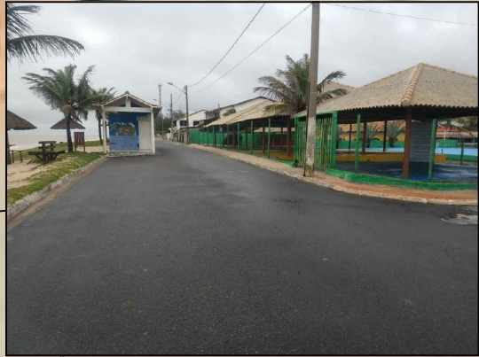
LOCAL PARA INSTALAÇÃO DE PEDAL KARTS.