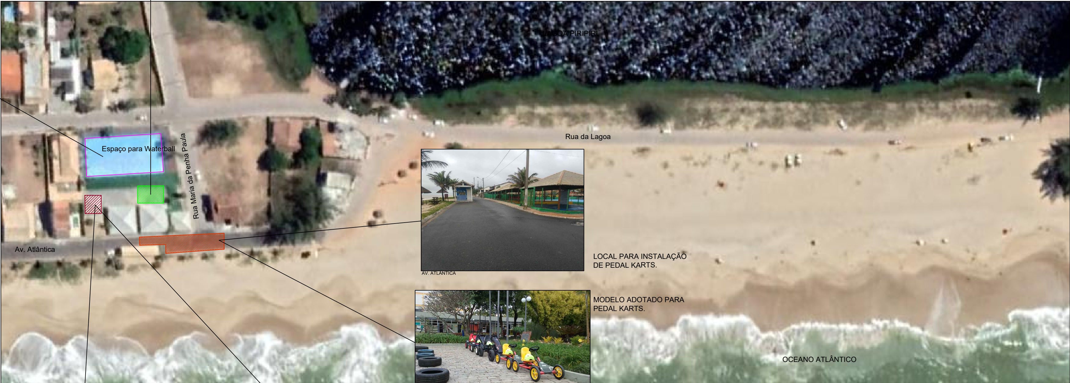
IMAGEM: PRAIA DE JOÃO FRANCISCO - QUISSAMÃ-RJ.