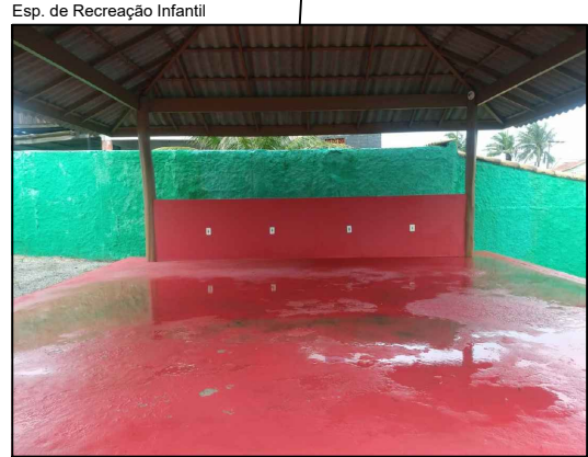
LOCAL PARA INSTALAÇÃO DA ARENA GAMER.