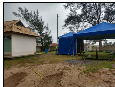
LOCAL PARA INSTALAÇÃO DOS EQUIPAMENTOS DE HIGH JUMP E TENDA DE APOIO 10X10.