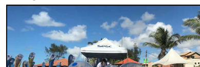
PISCINA WATER BALL