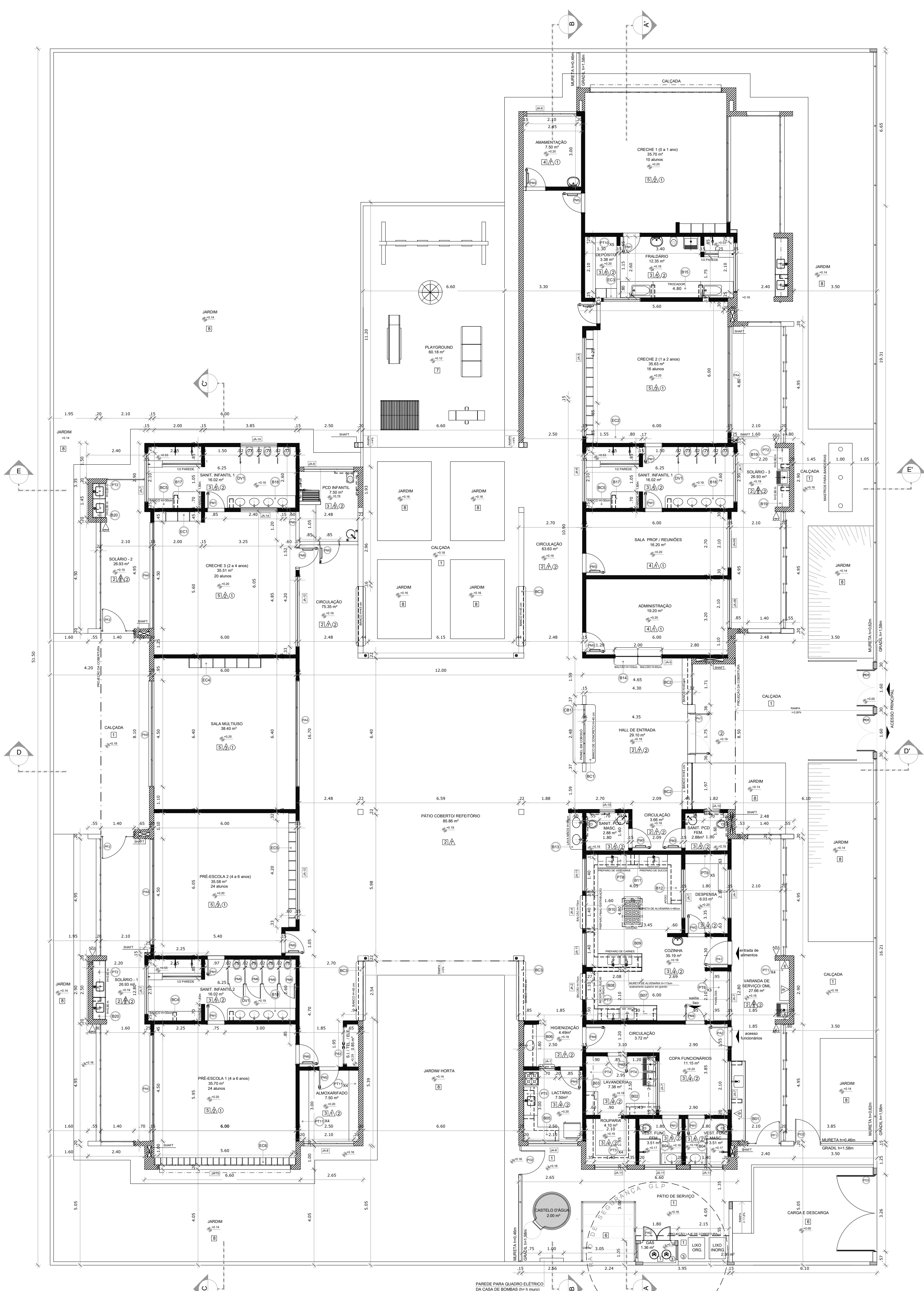
1 PLANTA BAIXA ESCALA 1/100