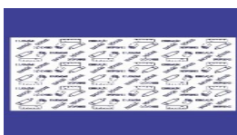
Imagem do forro