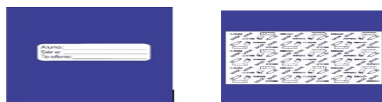
Imagem do forro e identificador