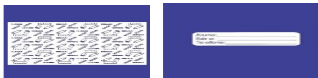
Imagem do forro e identificador